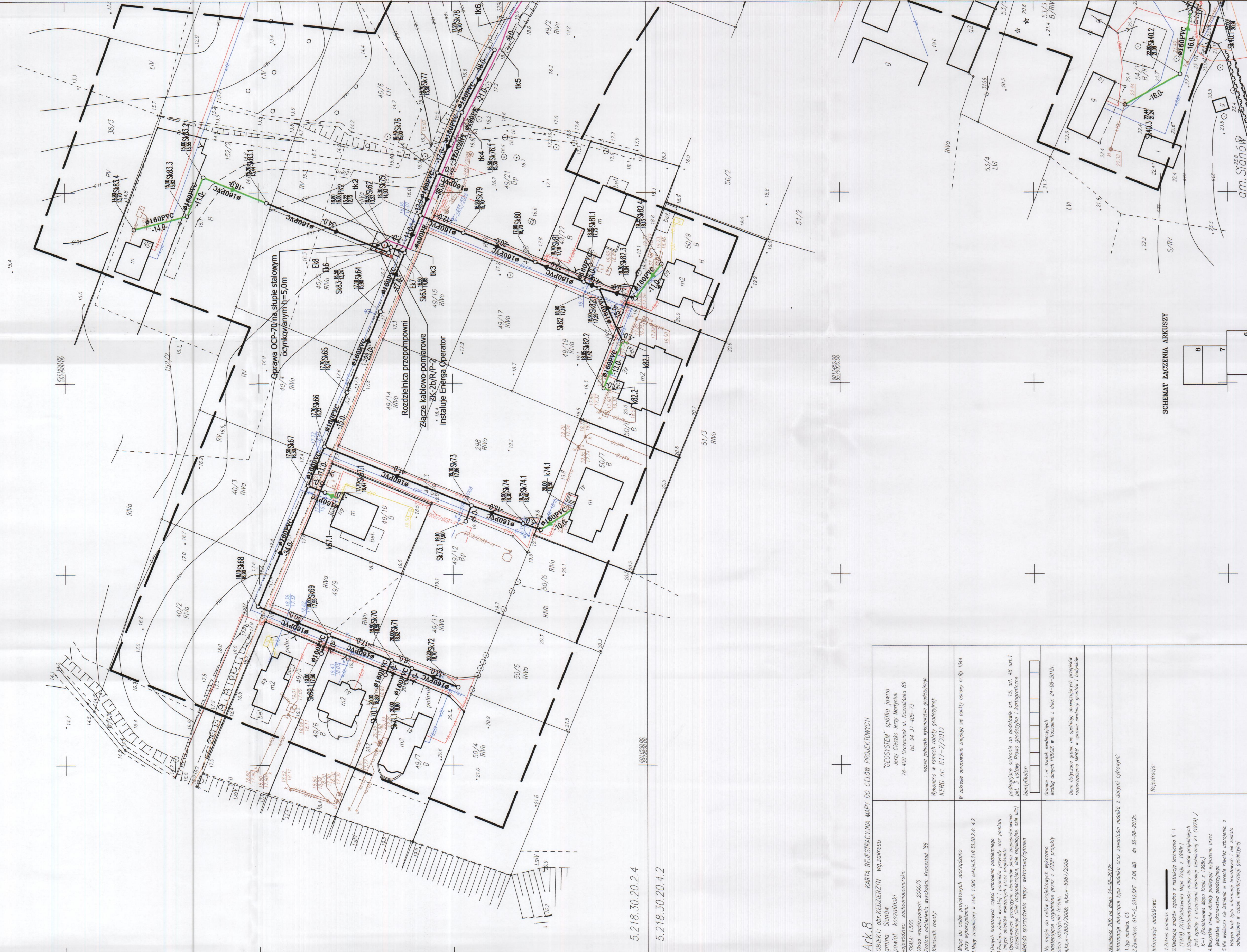
SCHEMAT ŁĄCZENIA ARKUSZY